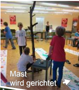
Mast wird gerichtet