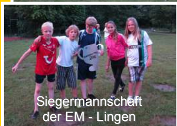
Siegermannschaft der EM - Lingen