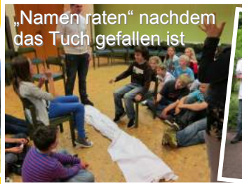
„Namen raten“ nachdem das Tuch gefallen ist