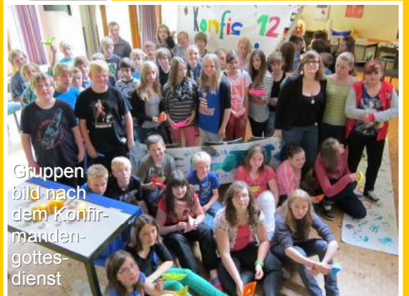
Gruppen bild nach dem Konfir- manden- gottes- dienst