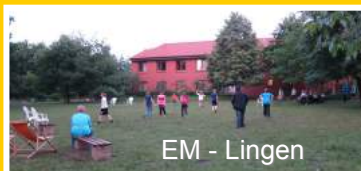
EM - Lingen