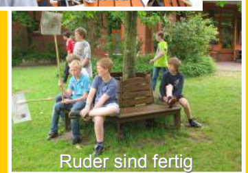
Ruder sind fertig